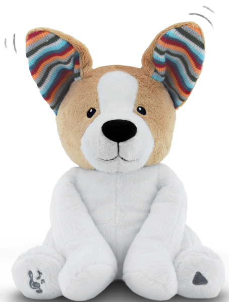
Danny the dog

B Press the RIGHT FOOT Danny will start playing the Peek-a-Boo game by covering his eyes and saying: 'Where are you...Peek-a-Boo, I see you' .